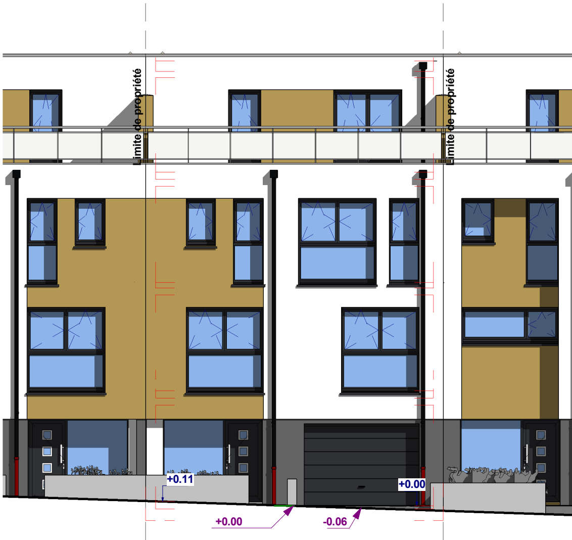
1 Façade avant Ech : 1 : 100